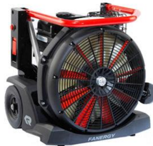
• توربو فن نجات