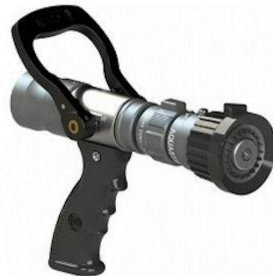
• انواع لانس مناسب برای دبی ها و فشار های مختلف