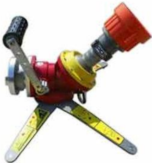
• مایتور فوم