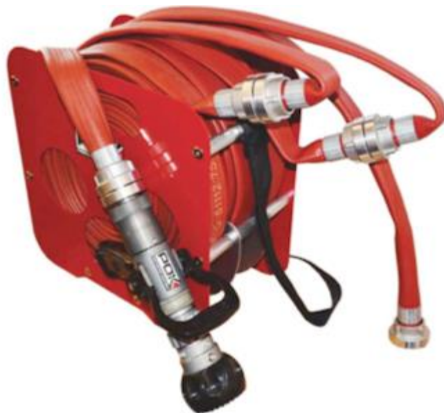
• انواع هوزریل سیار